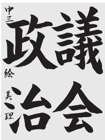
中村 絵美理 中3 6段

細い線を中心にリズムに乗って書かれた、余白が美しい作品。時折見せる太い線が文字の中にメリハリをつけて素晴らしい。