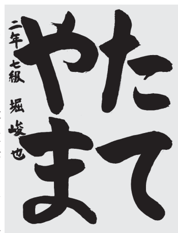
堀 峻也 小2 7級

つぎのせんへのつながりを大じにしている、むずかしい「ふ」のかたちが上手くとのつた。「く」のちよくせんもきれいだ。