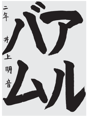
井上 明音 小2 6級

文字の中しんをうまくとらえてまん中はどうどこうつけた。せんをかくスピードがよく、とくにちよくせんがいいかんじ。