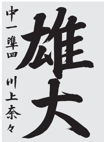
川上奈々 中1 準4

線の長さや太さを上手く使い分けて字の中の余白を生み、形を美しく整えた。特に長い直線や左ハライの思い切りが良い。