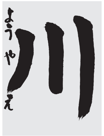
しらもとやえ 幼年 9級

やまからながれてくるおおきな「川」がみえてくるようだ。せんがつよく、三ほんともはじまりとさいごがよくできている。