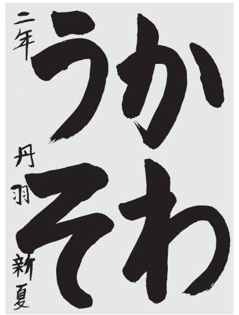
丹羽新夏 小2 7級

どのせんもばしよ、ながさ、ふとさがよくかんがえられて正しくかけている。ハライヤトメ、名まえもふでづかいが上手。