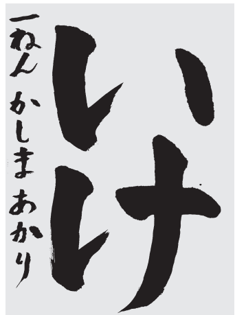
加 陽 明 莉 小1 3級

せんのはじまりをしつかりとまることができているので、ふとくつよいせんでかけている。このちようしでがんばって。