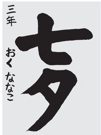
奥 な な こ 小3 準初

まがる線を書く時のふでのうごかし方が上手いので、さいごまで線が強い。形がととのった四文字をバランスよく書けた。