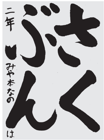
みや本なのは 小2 4級

せんのはしよ、ながさやくどをよくかえがえてかいて、かたしがきれい。ハネ、トメ、ハライもどれも上手にかけている。