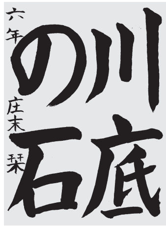
庄 末 葉 小6 準2

名前もだが、太い線が効いていて堂々としたりっぱな作品。始まりから終わりまで気持ちを込めて書いているのが伝わる。