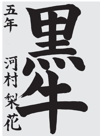
河 村 梨 花 小5 3段

直線が力強く、曲線の細かいふくらみ方が上手い。四文字とも大きさも良く、すきが無いくらいに字形がよく整っている。